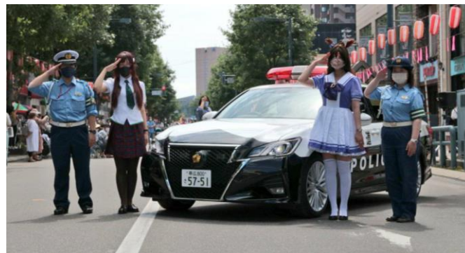
飲酒運転根絶キャンペーンチラシ配布 (帯広西2条通り)