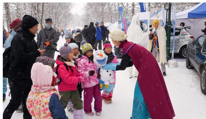
イベント来場者との交流(帯広氷まつり)