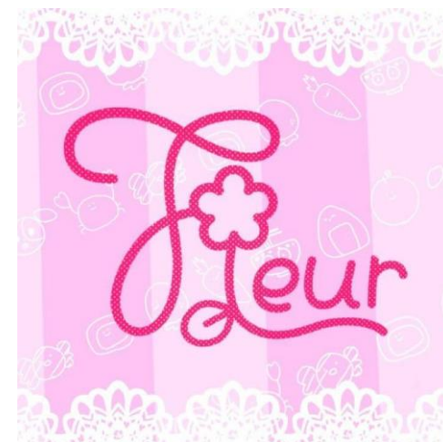
パフォーマンスグループの紹介、内部調整等