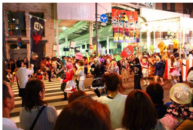
盆踊り参加(おびひろ平原まつり)