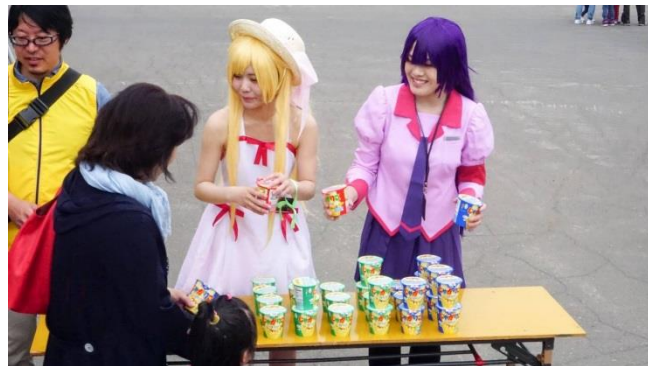
来場者プレゼントお渡し(帯広競馬場)