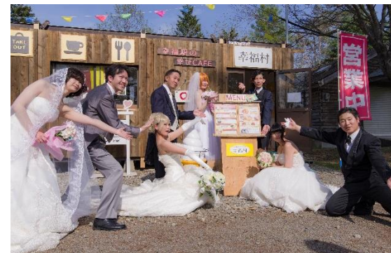
ハッピーセレモニー運営補助(幸福駅)