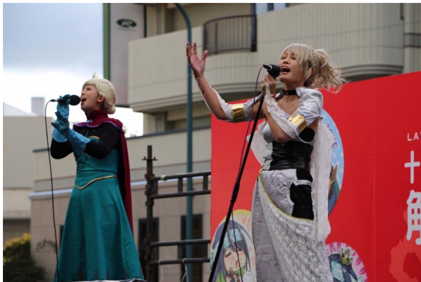
サークルメンバーによる歌唱パフォーマンス

★サブカルチャーパフォーマンスステージの出演、演者紹介など サブカルチャーに特化したダンス、歌、DJなどのパフォーマー紹介および出演協力、各種調整をいたします。