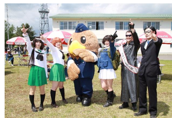
イベントPR協力(鹿追駐屯地記念行事)